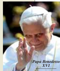
Papa Benedetto XVI

Sui dati in controtendenza delle donazioni di associazioni e imprese di certo ha pesato il ruolo istituzionale delle Fondazioni di origine bancaria che hanno attraversato un anno estremamente complesso sotto il profilo dei rendimenti del proprio patrimonio. «Per esse», aggiunge Gallazzi, «subito dopo l'approvazione del bilancio dell'esercizio 2008 si aprirà una vera e propria stagione di revisione e ristrutturazione delle proprie politiche investitive». Sul profilo del singolo donatore italiano, invece, si può affermare che è donna: il 38% della popolazione femminile ha effettuato una donazione contro il 20% degli uomini. Vive nel Nord Ovest (dove il 35% è donatore contro il 32% del Nord Est, il 30% del Centro e il 23 di Sud e Isole). È laureato: il 45% contro il 30% di chi ha la maturità e il 23% del resto della popolazione. Si dedica anche a altre forme di solidarietà (il 63% dei volontari è donatore). (riproduzione riservata)